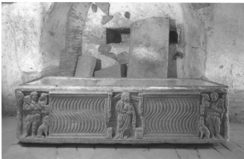
Слика 4: Саркофаг у катакомбама Светог Калиста (Рим, 3. век).