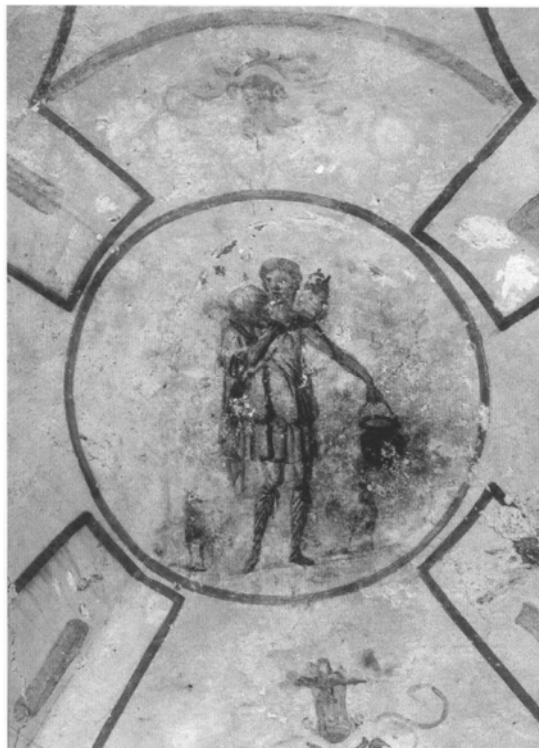
Слика 3: Добри Пастир из крипте Луцине у катакомбама Светог Калиста (Рим, 3. век).