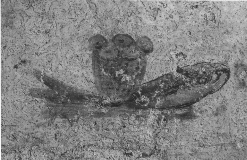
Слика 5: ΙΧΘΥΣ (Ихтхис): Еухаристијска риба (катакомбе Светог Калиста, Рим 2. век).