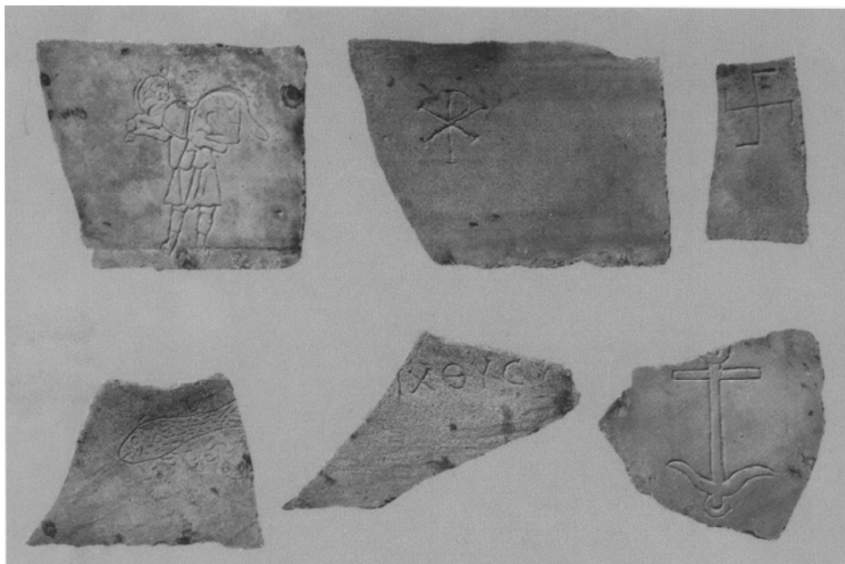
Слика 6: Хришћански симбол из катакомби Светог Калиста (Рим, 2. век).

овна на плећима. Можда је то значење „Доброг Пастира“ у катакомбама Светог Калиста у Риму (трећи век). У току ере Овна, овнујски рогови су красили главу Амона-Зевса; Александра Великог су многи уметници такође представљали са овнујским роговима на глави, као сина Амона-Зевса. Удаљени одјек ове ере је Микеланђелова статуа Мојсија са овнујским роговима.